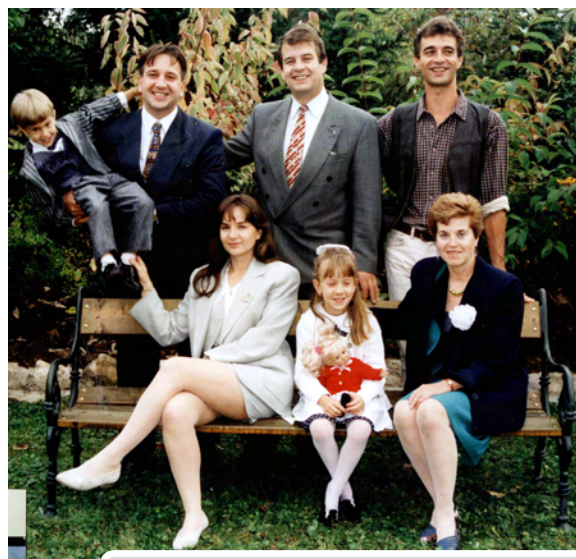
Die Gesellschafterstruktur im Jahr 1997.