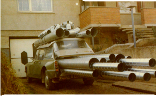
Die Möglichkeiten von Transport und Montage (Abbildung oben 1973) haben sich in den letzten 45 Jahren maßgeblich verändert.