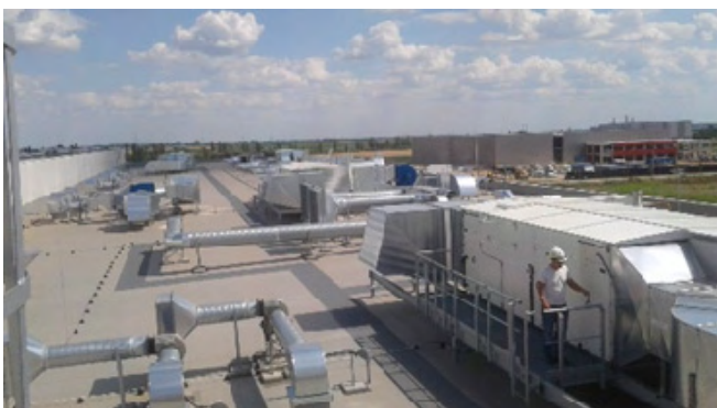
TAIKISHA - Nissin Food Kecskemét - Produktion und Installation der Lüftungsgeräte (1.000 m 3 /h- 27.000 m 3 /h) sowie die Installation des Wasser-, Abwasser- und Hydrantensystems.

Während der Rekonstruktionsphase von KIKÁ Budapest in der Lehel út haben wir neben der Erneuerung des kompletten haustechnischen Systems auch einen neuen Luftschleier produziert und installiert.