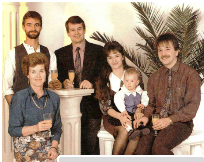
Die Gesellschafterstruktur im Jahr 1992.