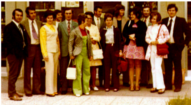
Die Belegschaft im Jahr 1974. Damals noch als radel&aufner.

In 45 Jahren kommt es in einem Unternehmen zu vielen Entwicklungen, Eindrücken und Veränderungen. So hat auch die radel&hahn Gruppe im Laufe der Jahre positive und negative Erlebnisse sowie persönlich und beruflich einschneidende Ereignisse durchlebt. Organisatorische und personelle Strukturen haben sich verändert und auch die Prozesse und Tätigkeiten, besonders der ausführenden Aufgabenbereiche, haben sich im Laufe der Zeit stets weiterentwickelt.