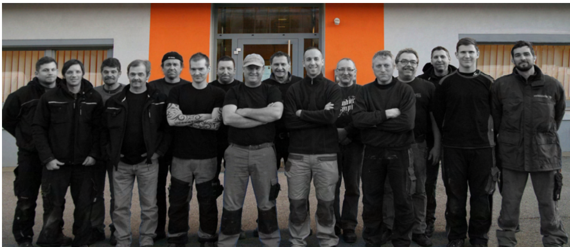
Die Lüftungsmontage- und Serviceabteilung von radel&hahn in Österreich heute.