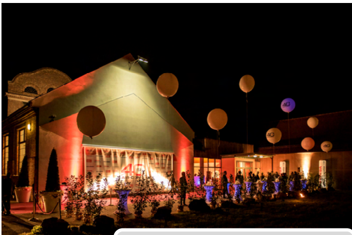
Gefeiert wurde in der Seifenfabrik in Graz.