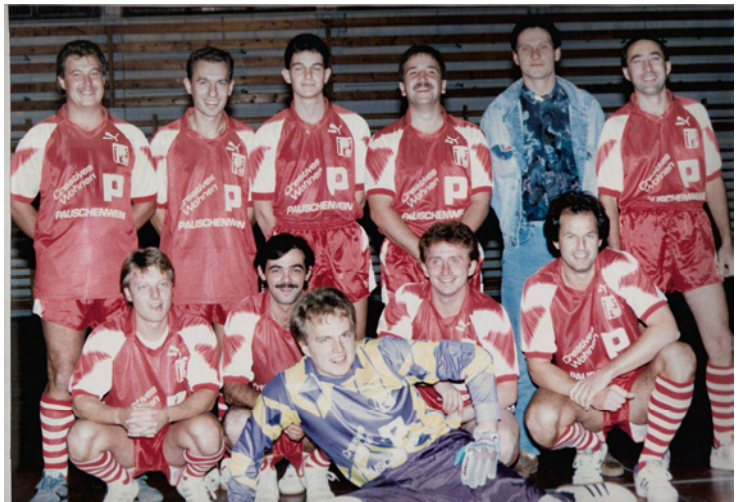
Internationales Fußballturnier in Debrecen 1992.