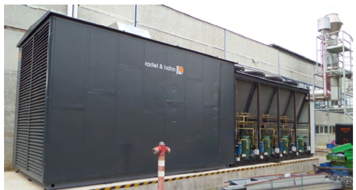
Continental Nyiregyháza - Lüftungstechnik