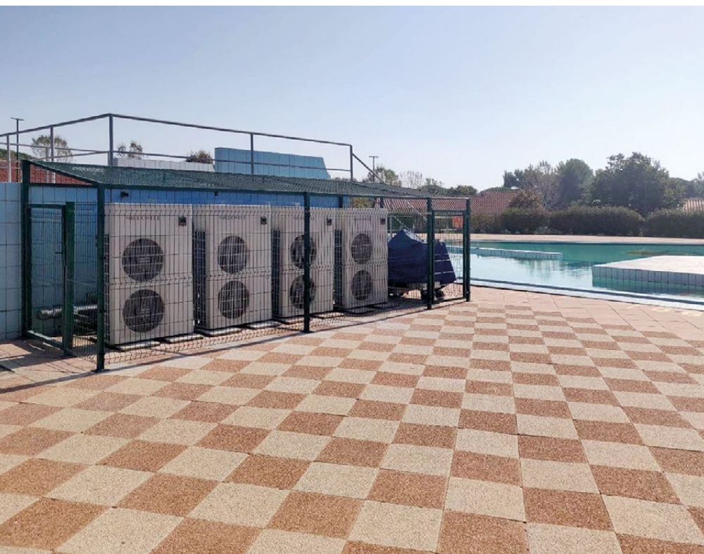
Čtyři venkovní jednotky HP 2600, vytápění koupaliště, Chorvatsko

Pro celoroční provoz je optimální vytápění bazénovým tepelným čerpadlem ve variantě SPLIT. V technické místnosti je umístěn bazénový výměník, do kterého vede izolované měděné potrubí z venkovní jednotky podobně jako u klimatizace.